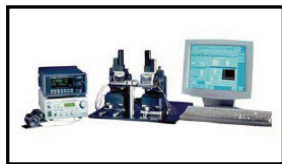
Modular Alignment System